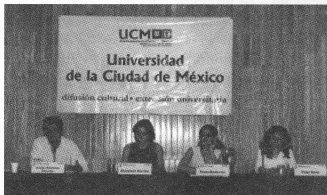
Fotografía: Leonardo Hernández, Mesa redonda Recuento de Chiapas

La autora del ensayo fotográfico, Frida Hartz, obtuvo el primer lugar en el concurso internacional Mujeres Vistas por Mujeres , convocado por la Comunidad Europea y también mención única en el premio Ensayo Fotográfico Casa de las Américas , de La Habana, Cuba, entre otros reconocimientos.. ▼UCM