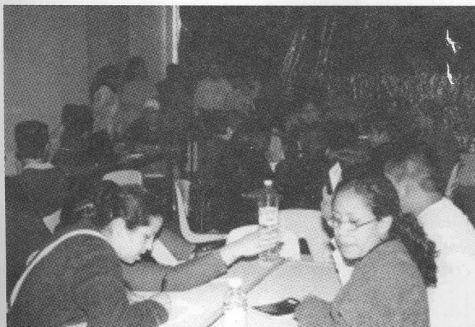
La comunidad universitaria espera pronto obtener la autonomía

En este artículo se menciona que la UACM “realizará investigaciones e impartirá conocimientos que