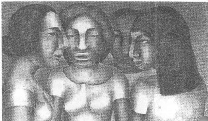
Mujeres conversando, Rufino Tari

Se contó con la participación activa de todos los estudiantes del Grupo UCMSocialClub , así como de personal del área administrativa. La obra se escenificó a las 13:15 horas en el