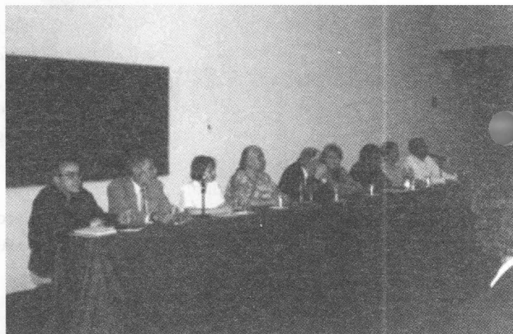
Inauguración Maestría Dinámica no Lineal y Sistemas Complejos

conocimiento científico. Uno bueno y, a juicio mío esperable, es encaminarlo a producir en nosotros, y en cualquiera a nuestro alcance, eso que el profesor Carlos Razo llama una insurrección del espíritu.” ▼UCM